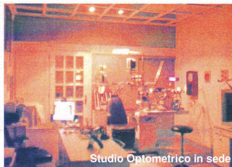
Studio Optometrico in sede